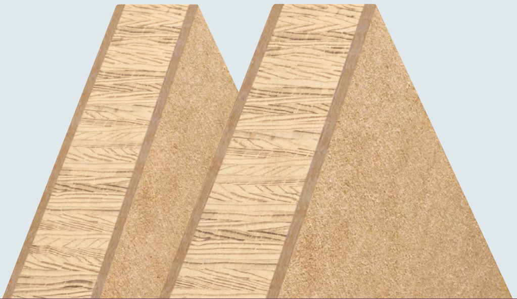
Moralt LAMINESSE FireSmoke MDF (44 mm)